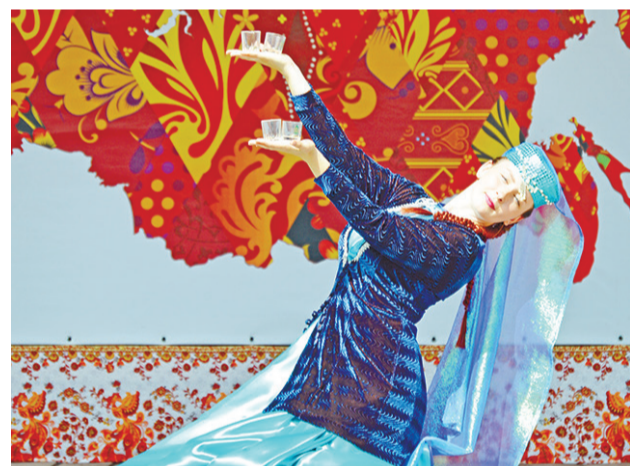
Азербайджанский танец со стаканчиками.