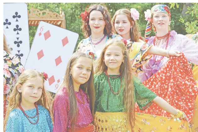
Краснополянский ДК организовал цыганское подворье.