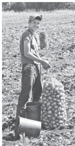
В сборе урожая в основном занята молодёжь.