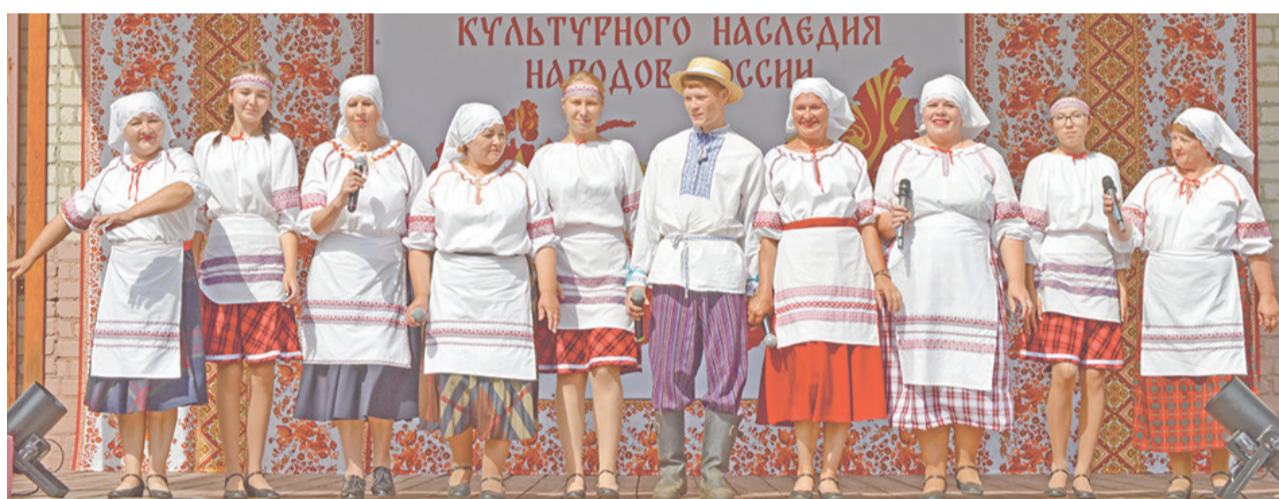
Чурманские культработники демонстрировали культуру белорусов.

Участие в фестивале приняли 300 человек. Большинство в этом году выбрали русскую культуру: вокальные группы «Пелевинские задоринки» (Пелевинский ДК) и «Липонька» (Липовский ДК),