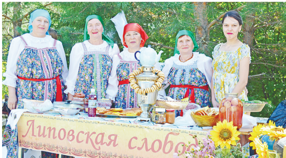
«Липовская слобода» с исконно русскими блюдами удивляла гостей разносолами.

Под таким названием прошёл традиционный районный фестиваль национальных культур в селе Краснополянское. Со всего района, и не только, съехались участники и гости на этот этнокультурный праздник. Творческие коллективы ярко, интересно, изобилием вкуснейших национальных блюд представляли культуру разных народов.