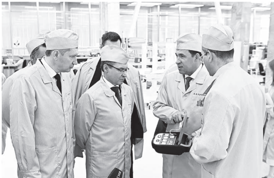
Максим Решетников назвал Средний Урал опорным регионом для экономики страны.

Он рассказал, что следит за ситуацией в регионе со времён, когда сам был губернатором Пермского края, и считает, что у Евгения Куйвашева есть всё, чтобы добиться успеха. Интересно, что федеральный министр ещё никому публично не выражал такой поддержки. Говорят, Решетников остался очень доволен поездкой на Урал и в неформальной обстановке обещал губернатору продолжать лоббировать интересы региона в Москве.