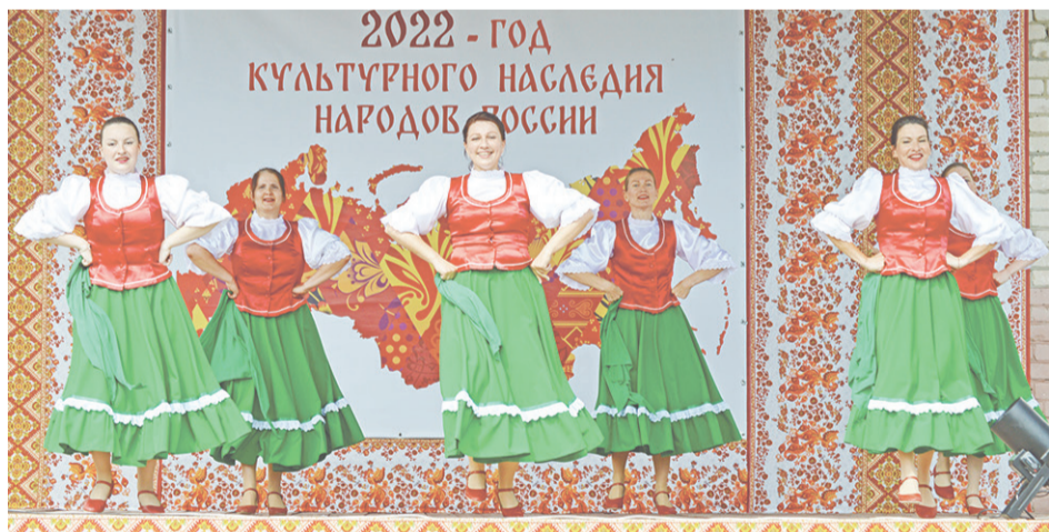
Танцевальный коллектив «Овация».