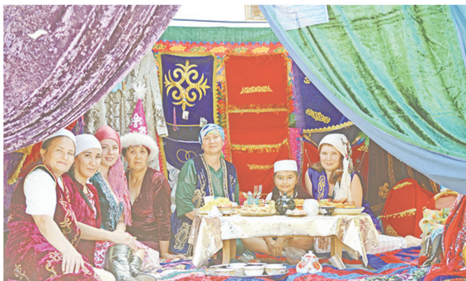
Семья Саламбаевых представляла казахов.